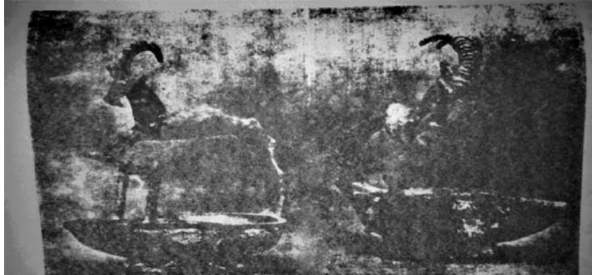
قنديلان من صنّع العربيّة بظّهر فيهما بعض حيوان البلاد تصوير ٣ تصوير صفحة ١١ كتاب